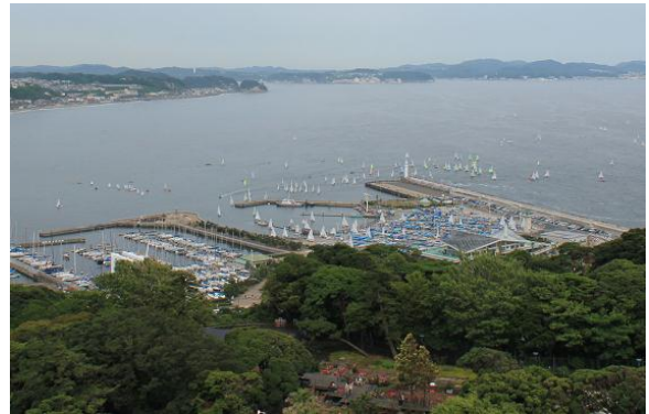
江の島ヨットハーバー。