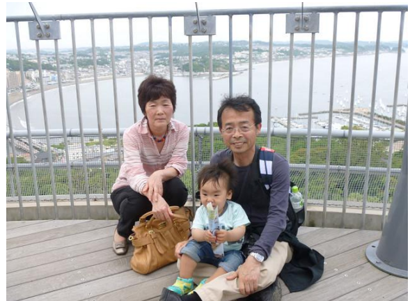
江の島展望塔台の展望台