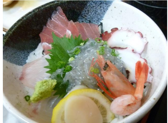
生しらすも入った海鮮丼