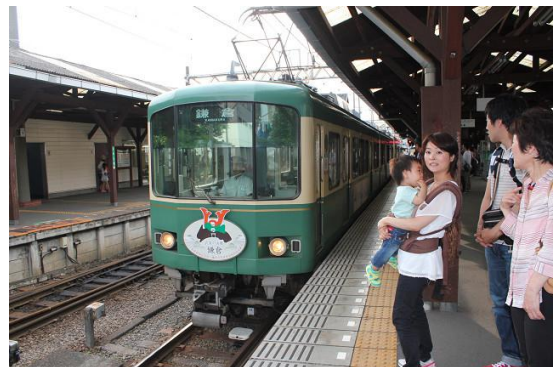
17時、電車に乗って鎌倉に向かう。