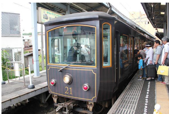
江ノ島電鉄の電車

江ノ島線の沿線には、電車が来るのを待ち構えているカメラマンが大勢いた。大した電車でもないのになぜこれほど人気があるのか不思議である。