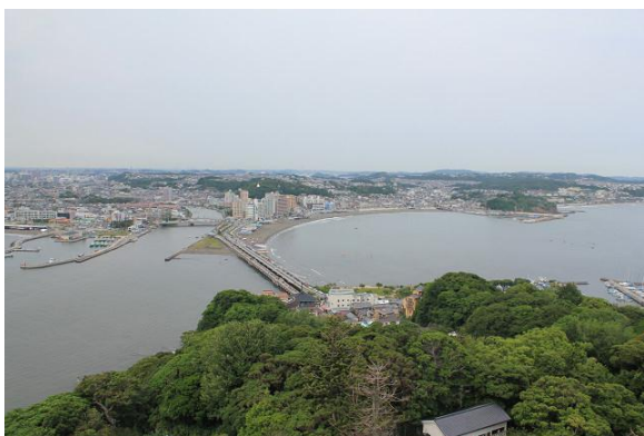
江の島展望灯台からの眺望。