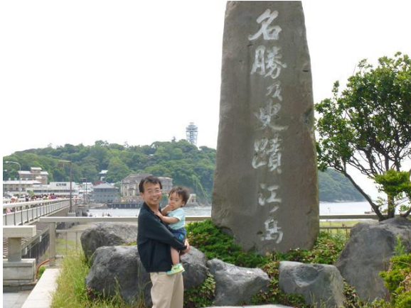
本土と江の島を結ぶ「江の島弁天橋」