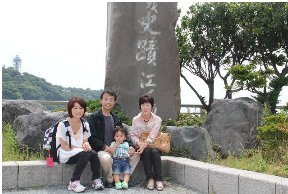
江の島弁天橋のたもとで記念撮影